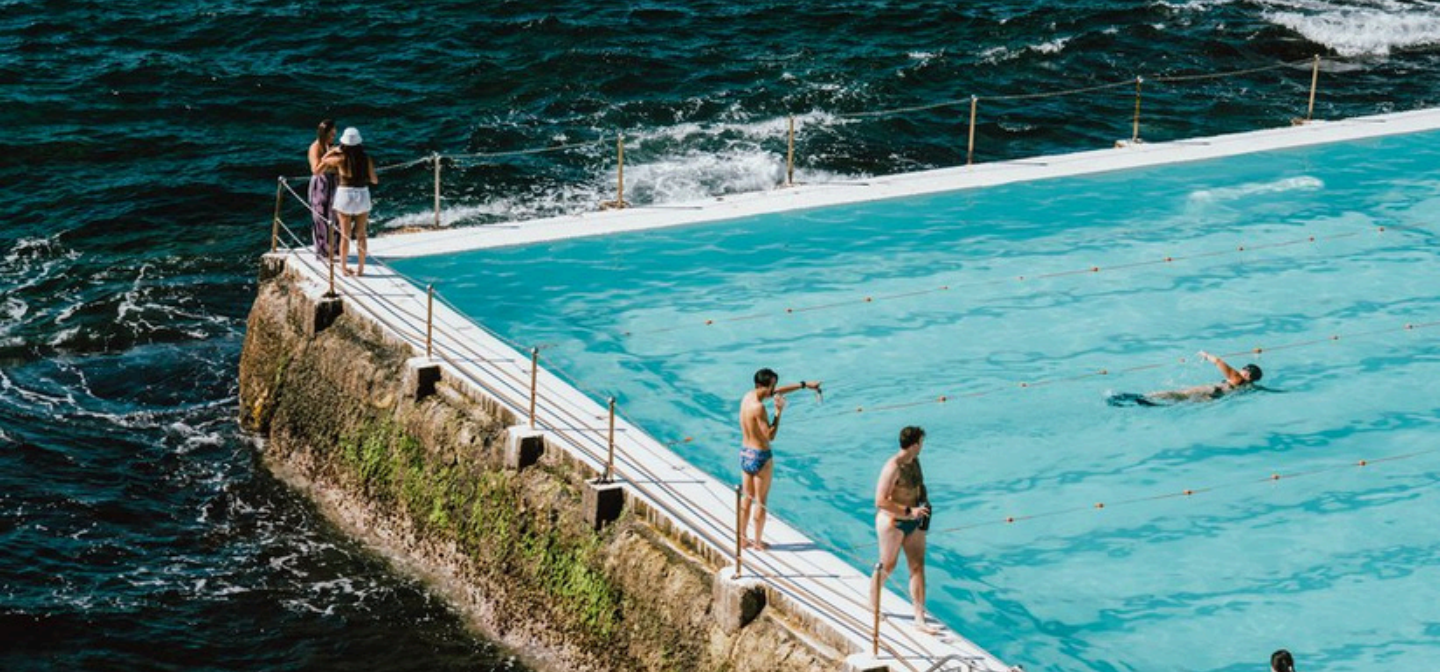
Icebergs Pool · Bondi Beach · Sydney · Nouvelle-Galles du Sud