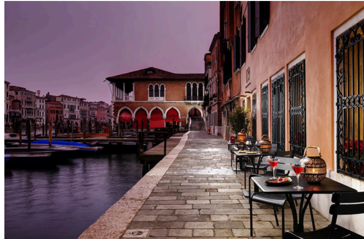
Restaurant de l'hôtel / Hotel restaurant