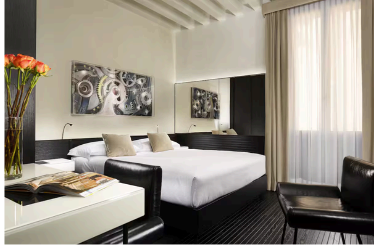
Chambre catégorie supérieure / Superior room