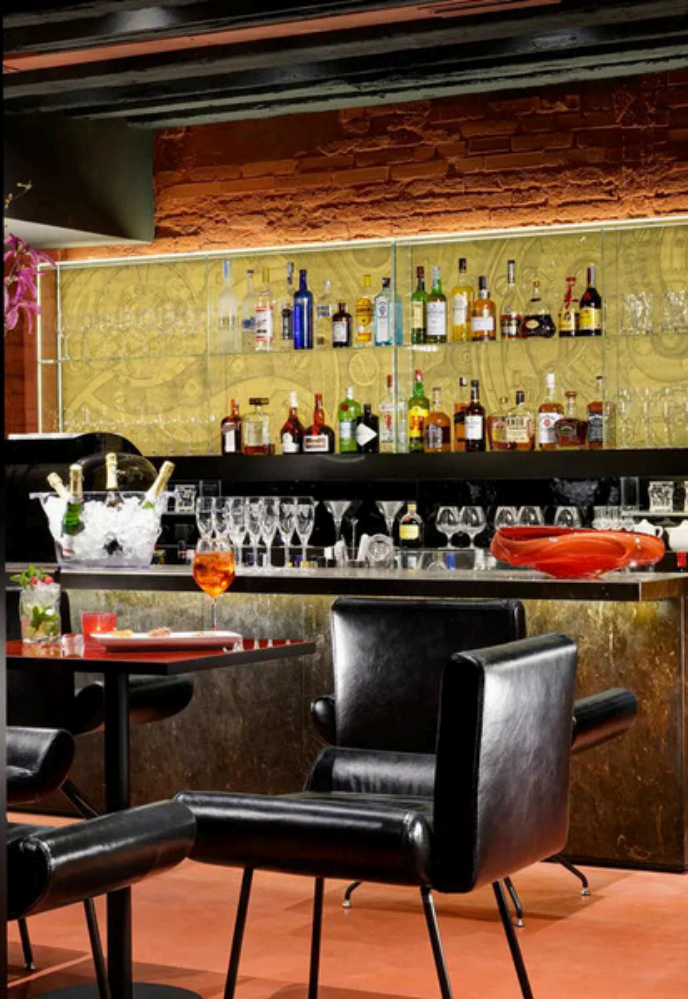
Santa Cocktail Club · Bar · Riva de l'Ogio · Grand Canal